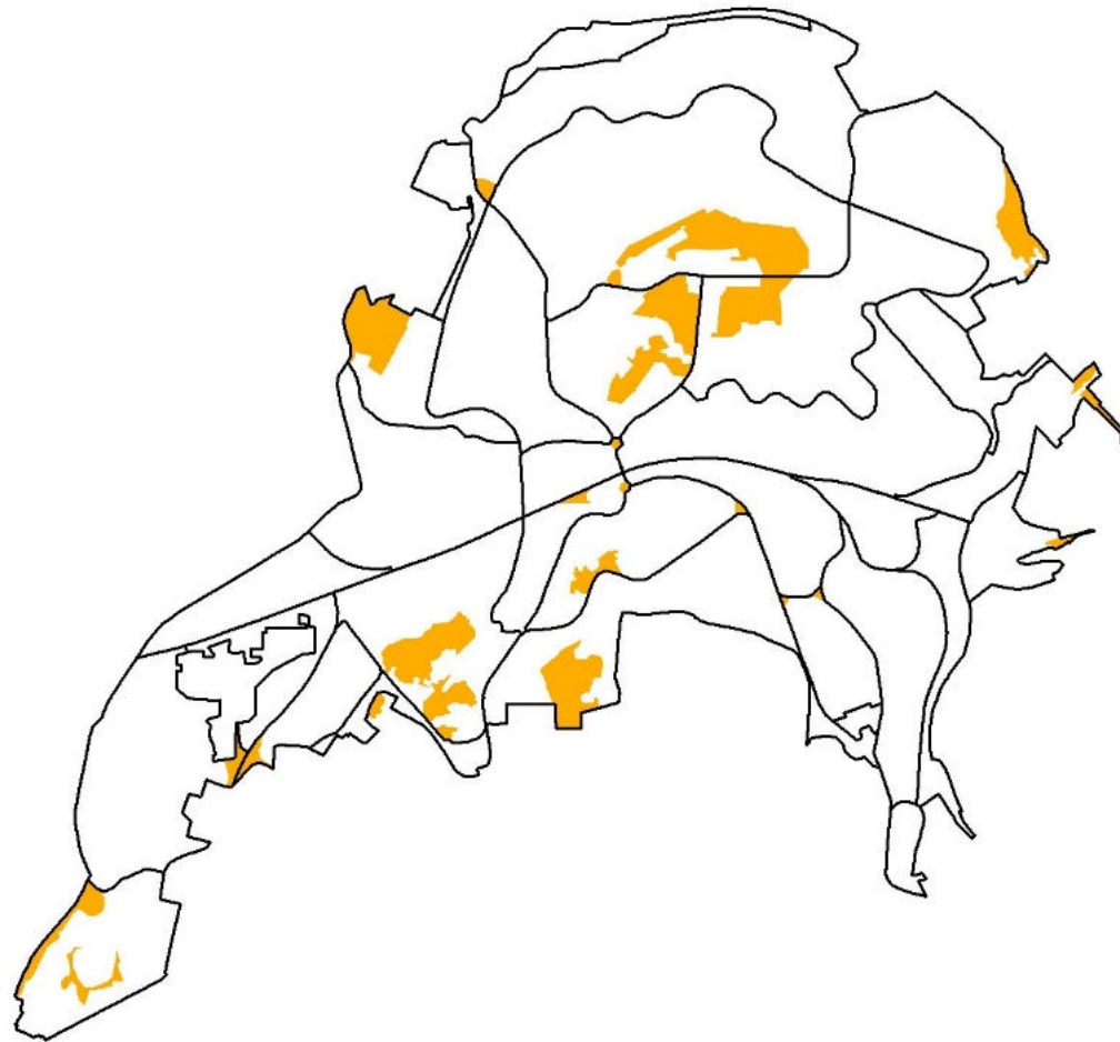
ervados de sequeiro